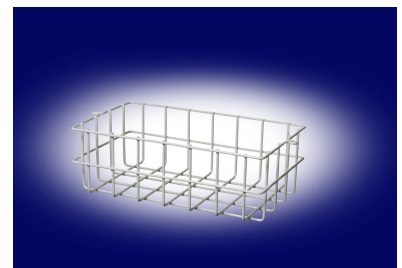
Z - 6100